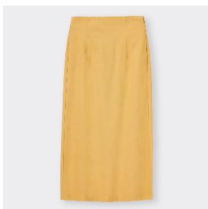
レースアップナローミディースカート ¥1,990 4色展開 XS-3XL