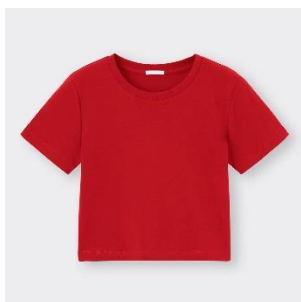
コットンミニT ¥790 8色展開 XS-3XL