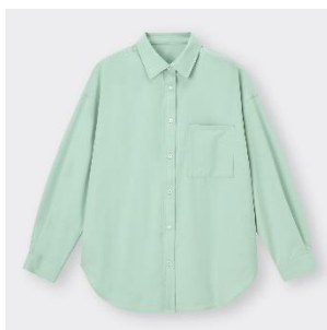
オーバーサイズシャツ ¥1,990 3色展開 XS-3XL