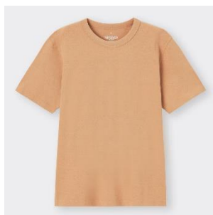
コットンクルーネックT ¥790 8色展開 XS-3XL