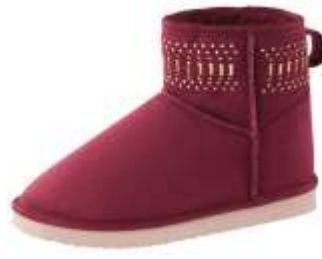
ムートンタッチブーツ(スタッズ)