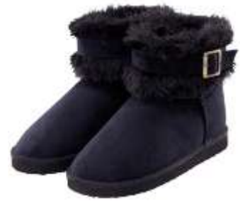
ムートンタッチブーツ(ベルト)