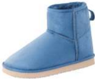
ムートンタッチブーツ