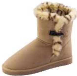
ムートンタッチブーツ(トグルホタン)