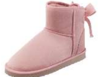
ムートンタッチブーツ(リボン)