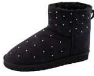
ムートンタッチブーツ(ラインストーン)