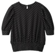
ドットプリントブラウス 価格: ¥1,990(税抜)