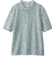
レースフリルネック T(半袖) 価格: ¥1,490(税抜)