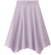
イレギュラーヘムミディスカート 価格: ¥1,990(税抜)